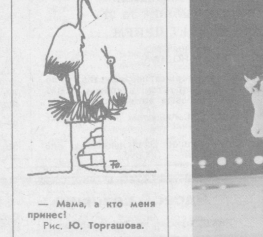
— Мама, а кто меня принес! Рис. Ю. Торгалова.