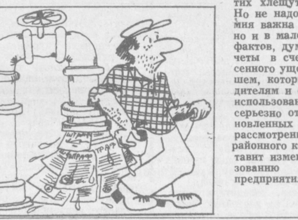
Рисунки И. Чумачиченко.

Почему председатель районного комитета народного контроля Фаринский не решительно, мог ли он не созвать всю чудовищную комиссию по расследованию этого — такого кандидата и подобрать? И отделивают отделочники квартиры, какие им укажут. А оказывается депутат чуть менее стеснительным, чем предполагали, — отделяются от депутата. По той же внутренней мотивации. Закон, установлен на перестройку — это дескать, высокие слова, нарядные, как выходной костюм. В них радуются по праздникам, поднимаясь на трибуну. А в будни