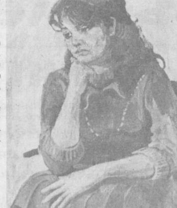
Воспитание рабочей смены

Мы публикуем сегодня две работы Ш. Парсеговой из серии «Портреты современниц».