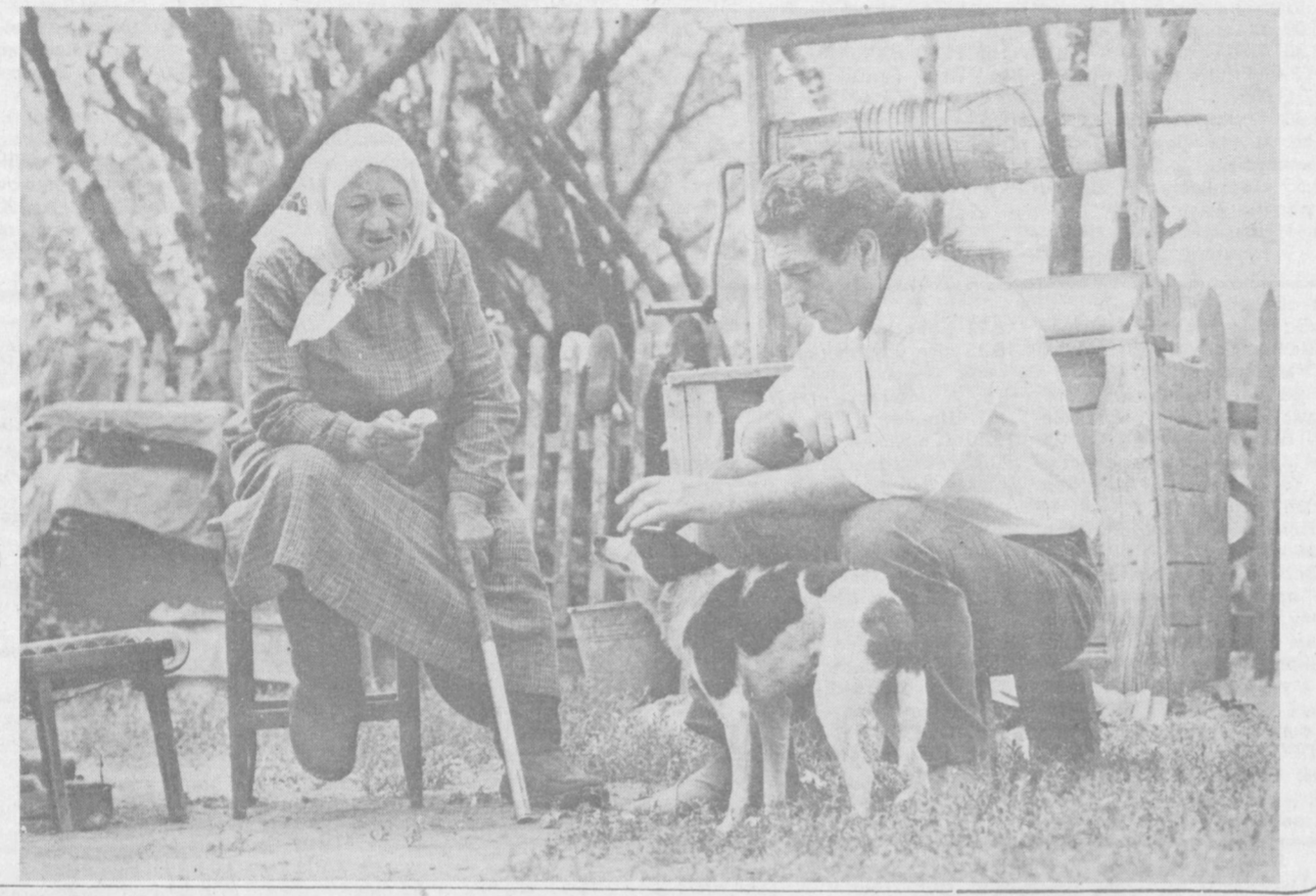
На ВДНХ УзССР