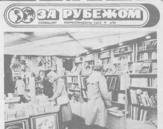
ПАРИЖ. Всегда много посетителей в магазине «Глоб», специализирующемся на продаже советской литературы.