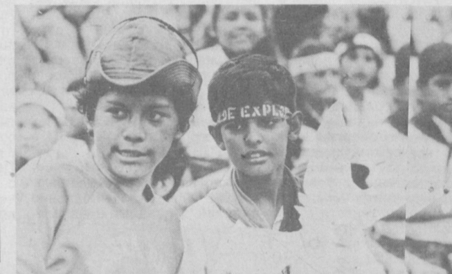
Дети свободной Никарагуа. Зарбота о счастье, о здоровье, образовании подрастающего поколения — одна из главных задач, стоящих перед молодой республикой. НА СНИМКЕ: на детском празднике в Манагуа.

ми, рисунками, фотоснимками. Немалый интерес вызывает и специальный раздел, где представлены макеты всех главных автомобильных и железнодорожных мостов республики. В замковом парке разбита выставка о развитии транспортной техники — от примитивных приспособлений прошлых веков до современных могучих машин и механизмов.