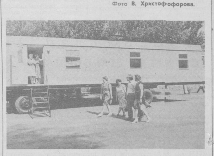
▲ ВОРОШИЛОВГРАД. Первую партию сборных домов на колесах отправил в районы, прилегающие к Чернобыльской АЭС, коллектив Ворошиловградского автобронировочного завода. Внутри домик мало отличается от современной благоустроенной городской квартиры. К услугам жильцов — холл, две спальни, кухня-столовая, просторная прихожая, санузел. Меблируются комнаты прямо на заводе. Кухонная оборудована электроплитой и холодильником, есть и индивидуальная котельная. В таких домиках с коммунальными удобствами размещаются общины. Трудные коллективы, работающие на ликвидацию последствий аварии, уже получили и такие вагоны-душевые. НА СНИМКЕ: так выглядит вагон-община.

▲ ЛЕНИНГРАД. Значительно повысить отдачу мелиорированных земель на северо-западе страны помогут исследования научных коллективов Междуведомственного координационного совета Академии наук СССР. В институте «Ленинградхоз» завершены анализы предельных и орошаемых угодий региона. Сегодня хозяйства Ленинградской области передают паспорта рекомендаций по повышению плодородия пахотных участков общей площадью 320 тысяч гектаров.