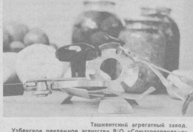
Ташкентский агрегатный завод. Узбекское рекламное агентство В/О «Союзторгреклама».

Научиться консервировать совсем несложно — нужно только приобрести необходимые приспособления. Ташкентский агрегатный завод выпускает специальные наборы для консервирования. В них входят: ЗАКАТОЧНАЯ МАШИНА, ПОДСТАВКА ПОД БАНКИ И УХВАТ. Цена закаточной машинки — 3 руб. 80 коп. Цена ухвата — 1 руб. 50 коп. Цена подставок — 40 коп., 45 коп.