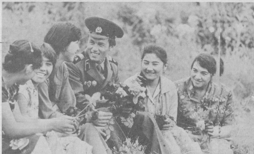
Девочки, которые ждут...

в Ташкентском высшем общевойсковом командном училище имени В. И. Ленина и Ташкентском высшем танковом командном училище имени маршала бронетанковых войск дважды Героя Советского Союза П. С. Рыбалко. Об этом наш небольшой рассказ.