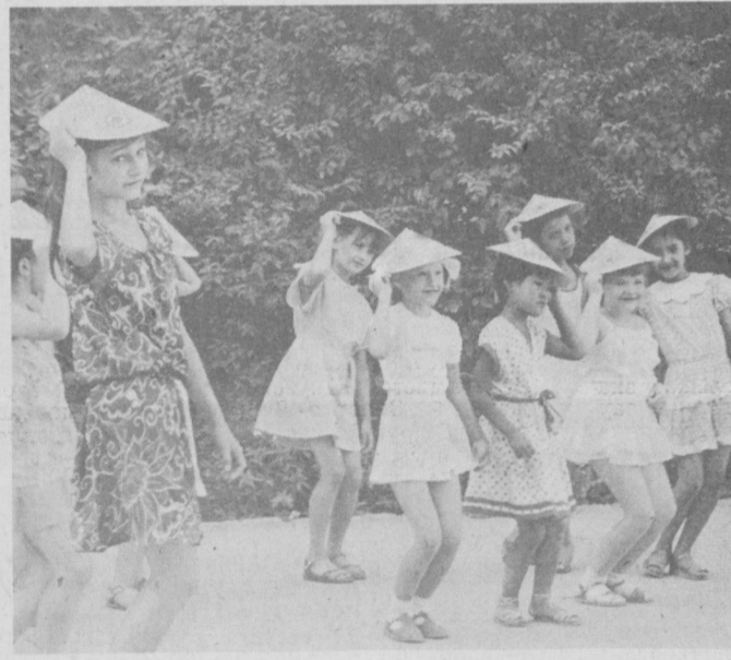
По наказам избирателей

в музей, завтра — в кукольный театр или спортивное соревнование «Веселые старты», на третий — конкурс на лучший танец, песню. Что ни день, то что-нибудь новое. В пионерском лагере на базе Дворца пионеров имени Н. Островского созданы различные кружки, в которых дети учатся рисовать, лепить, танцевать, разучивают новые песни, постигают секреты мажора. А на днях прошла интересная встреча с афганскими детьми, приехавшими на отдых в нашу страну. Одним словом, каждый день — что-то интересное. НА ЗАМЕТКУ: день начинается с зарядки; в танцевальном кружке идет репетиция вьетнамского танца.