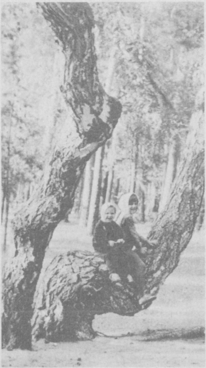
У лесного озера.