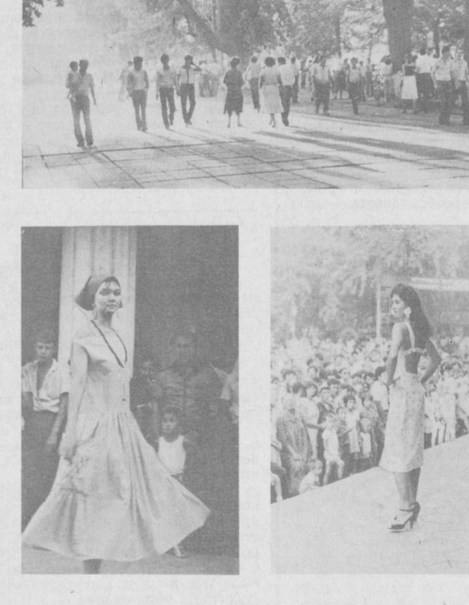
Пешеходная зона на улице Карла Маркса. В дни гуляний здесь становятся традиционными показы новых моделей одежды, которые проводит республиканский Дом моделей. На этот раз модельеры продемонстрировали образцы летних платьев для молодежи из хлопчатобумажных и смешанных тканей (на снимках).