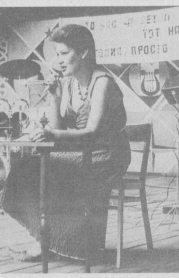
Ваше свободное время