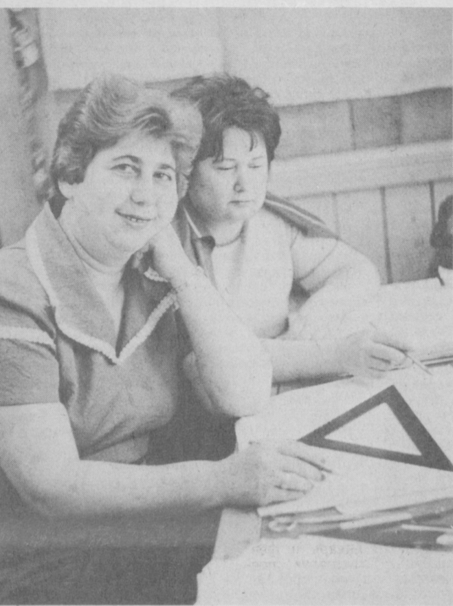
В ответ на Обращение ЦК КПСС к трудящимся Советского Союза, коллектив Ташкентского специализированного конструкторского бюро текстильных машин усилил свою работу по созданию нового поколения прогрессивной техники для текстильных предприятий страны. Среди работников конструкторского бюро развернулось социалистическое соревнование за досрочное выполнение заданий пятилетия.

И. ЛЮБОВСКИЙ, корр. пресс-центра Минводхоза УССР.