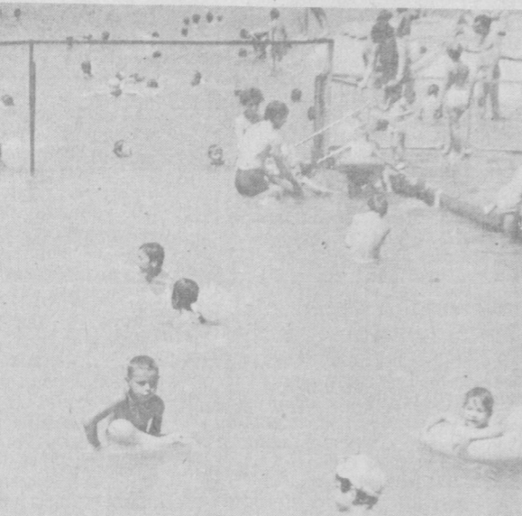
В этой связи хочется напомнить, что плавательный сезон в нашем городе практически не ограничен. Поэтому еще многое можно поправить.

В Таллине завершились выступления участников парусной регаты, входящей в программу IX летней Спартакиады народов СССР. Не совсем удачно выступили здесь посланцы нашей республики. Набрал в итоге всех гонок 47 очков, узбекистанцы оказались на 13-м месте. А победа досталась в острейшей борьбе флотилии из Москвы.