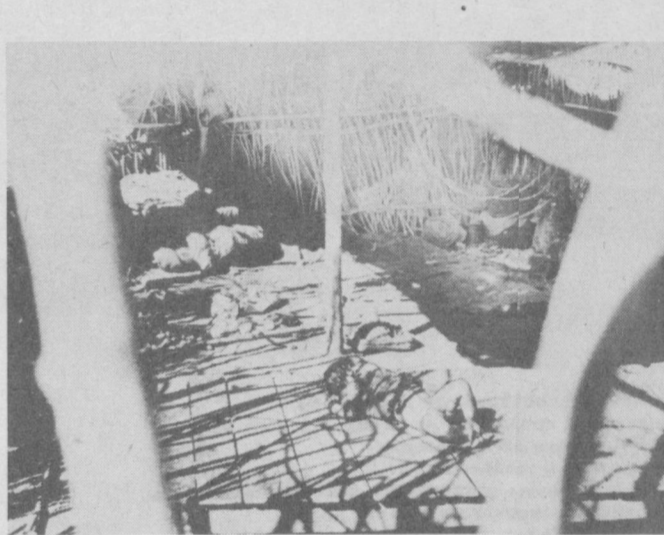
В этом городе, центре штата Мадхья-Прадеш, в декабре 1984 года случилась страшная катастрофа. Из подземных хранилищ завода американской транснациональной корпорации «Юнион карбайд» произошла утечка газа. 40 тонн отравляющих веществ попали в атмосферу. В окрестностях завода в мучениях гибли люди. Тогда сообщалось, что погибли 2,5 тысячи человек.

Минувло полтора года. Трагедия Бхопала, свидетельствуют авторы, продолжается. Многие бхопалцы надеются, что здоровье и несчастье обошло их стороной. Увы, они ошиблись. Больницы переполнены. По утрам перед ними выстраиваются громадные очереди все новых и новых страдальцев... Согласно исследованию врачей, отравление подверглись в общей сложности 250 тысяч человек. Здоровье их в разной степени подорвано. Придут годы, прежде чем выяснятся все губительные последствия катастрофы.