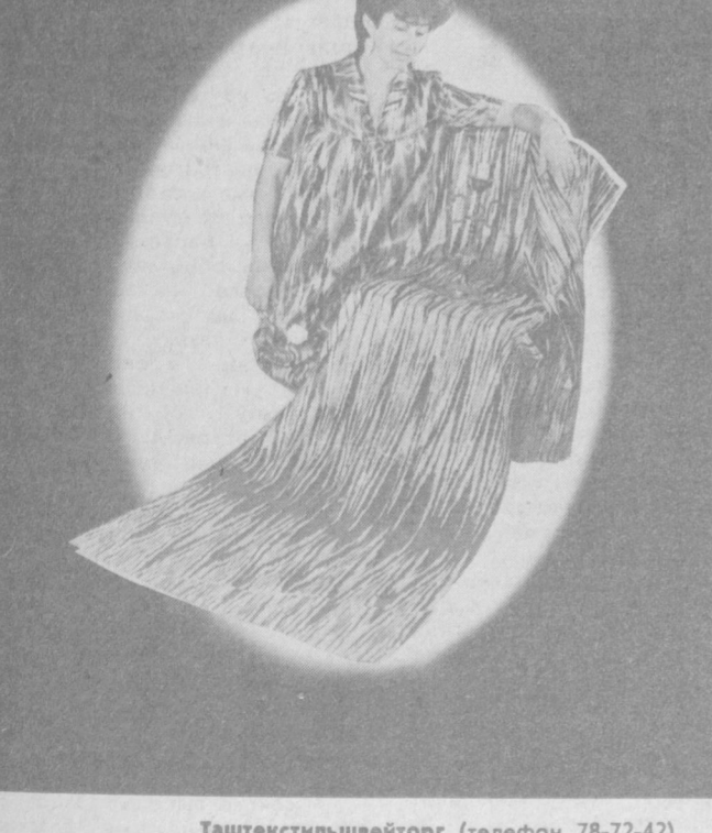
Ташкентстильвейторг (телефон 78-72-42). Узбекское рекламное агентство В/О «Союзторгреклама».

Продается хан-атлас в магазинах Ташкентстильвейтор-а. Цена — от 12 до 15 руб. 50 коп.