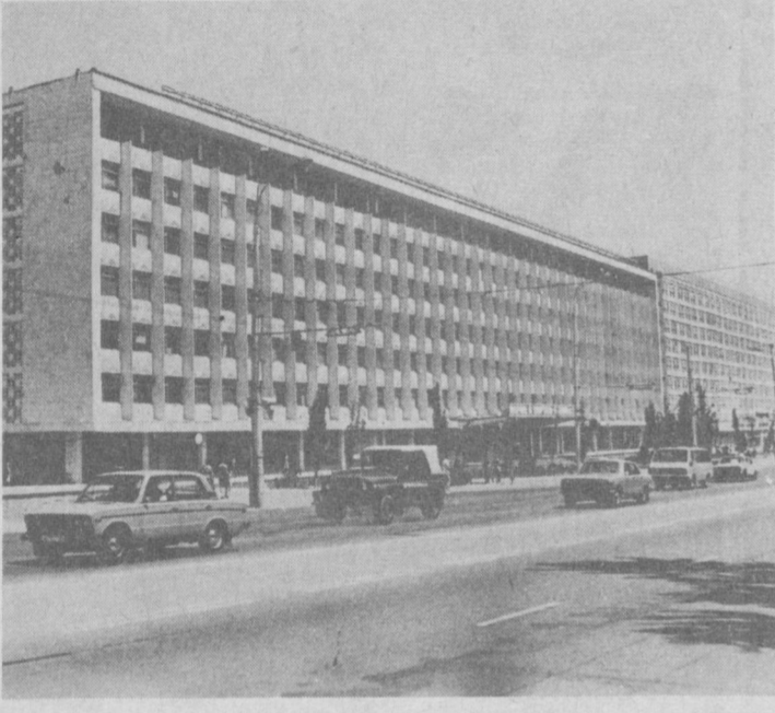
Самую разнообразную продукцию выпускают предприятия Куйбышевского района. Это тракторы и экскаваторы, редукторы и газовые плиты, лакокрасочные материалы и детские велосипеды, мебельные зеркала и многое другое. НА СНИМКАХ: улица Пушкинская сегодня; идет отгрузка тракторов, изготовленных в производственном объединении «Ташкентский тракторный завод имени 50-летия СССР».