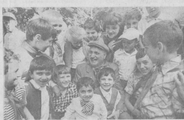
Рябтя навсегда запомнит встречи с Героем Социалистического Труда капитаном легендарного атомохода «Ариана» Юрием Кучивеи (на снимке), прославленной шахматисткой, международным гроссмейстером Нойой Гаприндашвили, другими интересными людьми.

Летний день заполнен интересными экскурсиями по достопримечательным местам Тбилиси, его окрестностей, спортивными состязаниями и