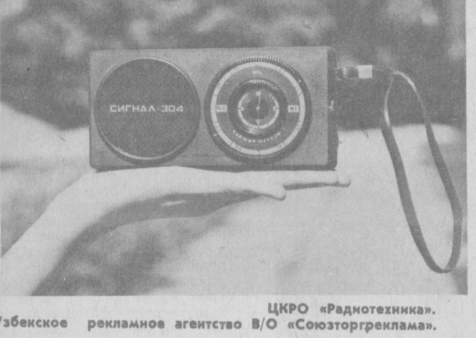
ЦКРО «Радиотехника». Узбекское рекламное агентство В/О «Союзторгреклама».