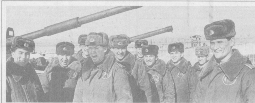
Солдат без шутки — не солдат...