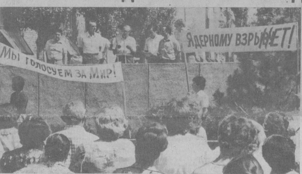
На снимке: митинг на Ташкентском агрегатном заводе в поддержку новых мирных инициатив КПСС.