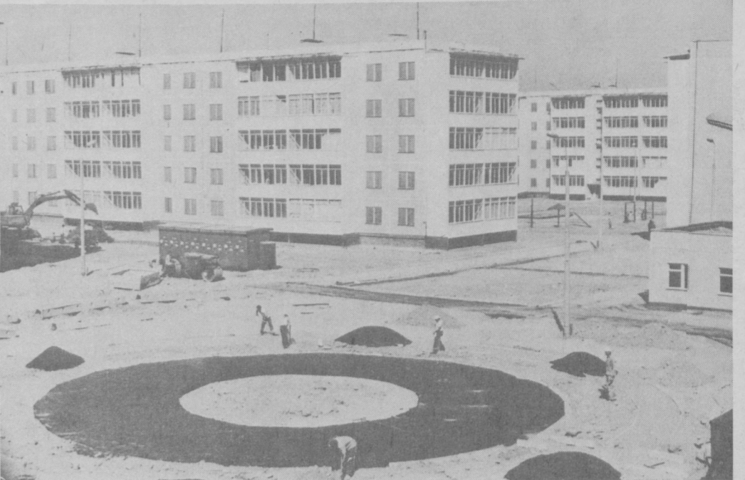
Коллектив домостроительного комбината № 3 Главташкентстроя: на три месяца раньше запланированного срока, сдан в эксплуатацию 90-квартирный жилой дом на массиве Сергеля.

Сейчас на комбинате без остановки производства идет реконструкция. Ее завершение позволит к концу пятилетия перейти к строительству не только девяти-, но и двенадцати-, шестнадцатиэтажных зданий с повышенной сейсмичностью.