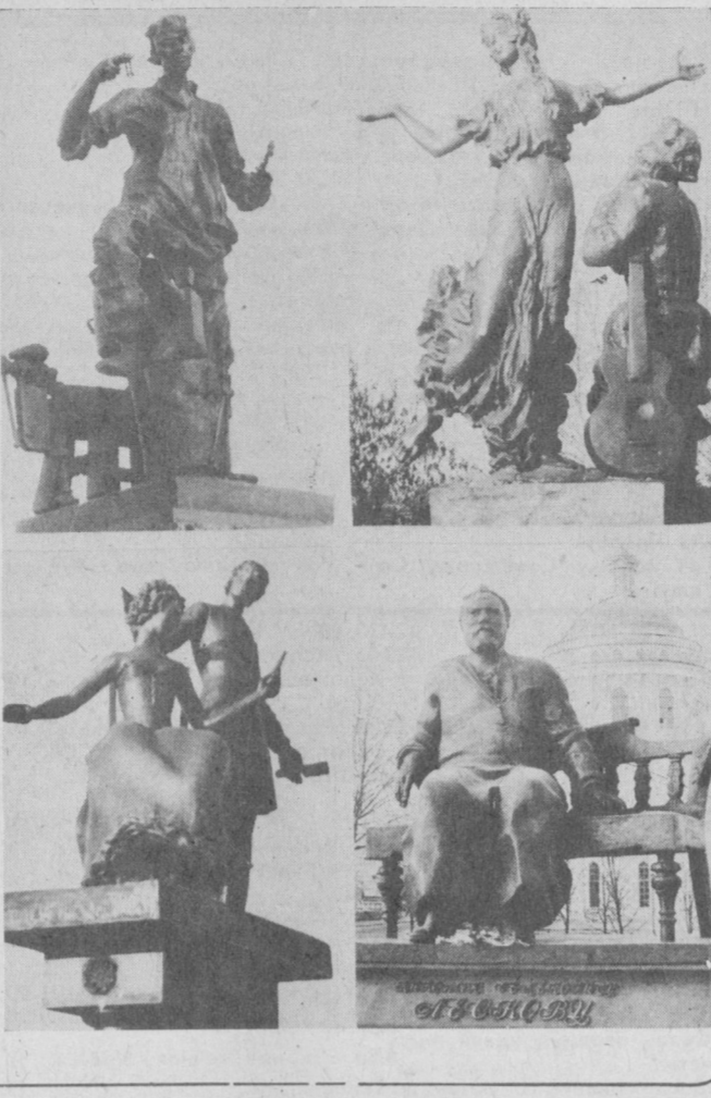
О. АПУХТИН. НА СНИМКЕ: фрагменты архитектурно-скульптурного комплекса — памятника Н. С. Лескову.