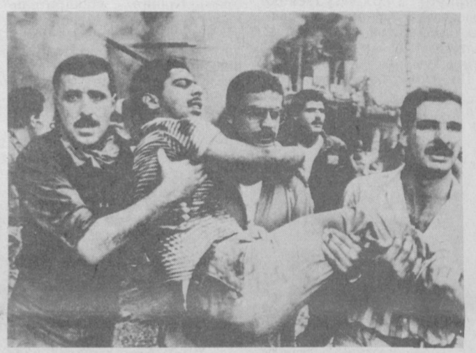
Мощный взрыв произошел в восточной части Бейрута. Силы, не заинтересованные в нормализации обстановки в Ливане, взорвали начиненную динамитом автомашину. В результате террористического акта убито и ранено около 200 человек. В близлежащих кварталах вспыхнули сильные пожары. НА СНИМКЕ: на месте взрыва.

БОНН. «Прочный мир и безопасность», «Разоружение и продолжение политики разрядки», «Прекратить гонку вооружений!», «Долой «Першинги», «Долой «звездные войны» — таковы основные лозунги традиционного антивоенного Дня действий, который пройдет в ФРГ 1 сентября по призыву объединения немецких профсоюзов (ОНП). Об этом сообщил в Дюссельдорфе представитель ОНП, рассказавший журналистам о подготовке к этой манифестации. В рамках Дня действий во многих городах ФРГ пройдут демонстрации в поддержку мирных инициатив Советского Союза, в том числе решения продлить одно-