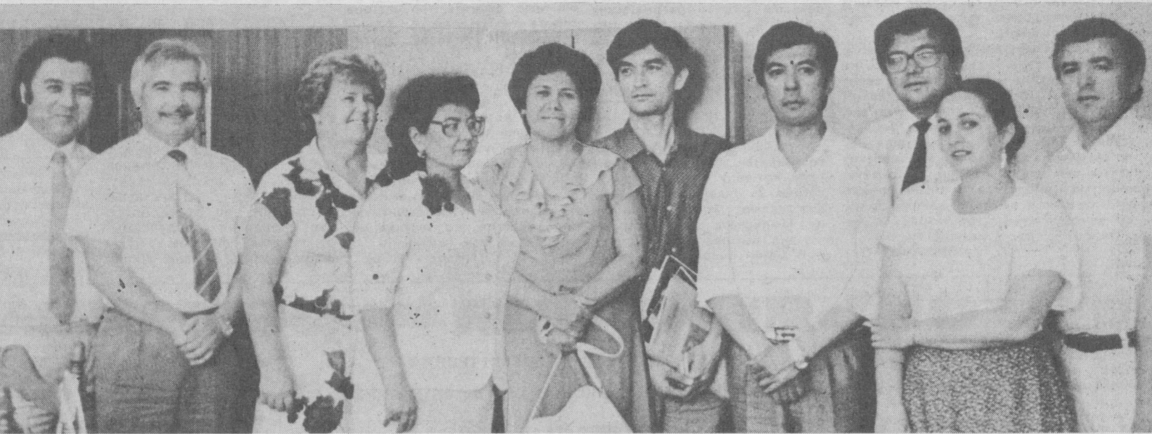
НА СНИМКЕ: гости — участники встречи.

Но только сознавать мало. Нужны конкретные шаги, конкретные действия, чтобы переломить существующую инерцию, в том числе и среди самих театральных работников. И, несомненно, нужна заинтересованная помощь им со стороны партийных организаций, Министерства культуры республики, средств массовой информации.