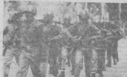
Занзибар — это небольшой остров у берегов Восточной Африки. Он входит в состав Объединенной Республики Танзании в качестве равноправного члена этого союза.