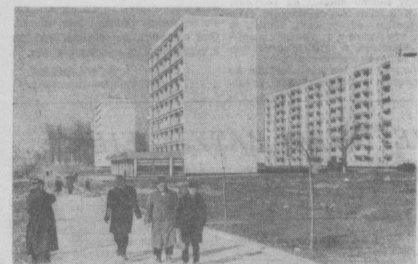
ТАШКЕНТ СЕГОДНЯ. Улица Навои.

Указом Президиума Верховного Совета СССР за заслуги перед Советским государством и Вооруженными Силами СССР в связи с семидесятилетием со дня рождения Маршала Советского Союза Василия Ивановича Чуйкова награжден орденом Ленина.