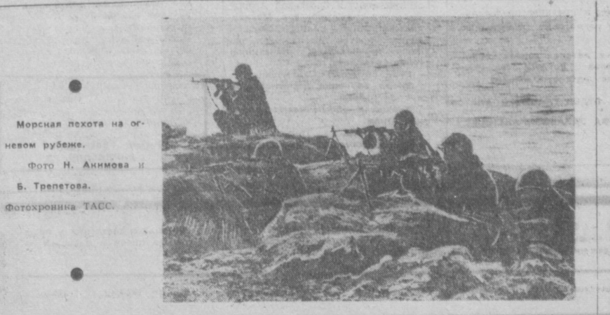
Морская пехота на оловом рубяже.