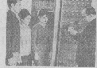
Так, за прошедшие 14

Корпуса института настолько новы, что еще можно заметить следы недавно законченной большой стройки: кое-где не сняты опалубочные доски, пахнет свежестью красок от мебели и оборудования, а в библиотеке «отдает» невыветрившимся клеом от вновь переплетенных книг и журналов.