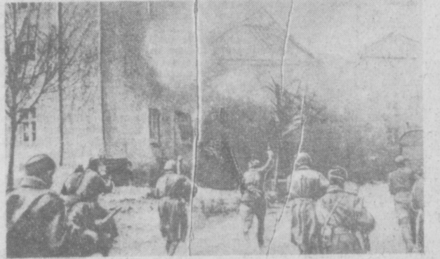
АПРЕЛЬ 1945 года. Третий Белорусский фронт. Уличный бой в Кенигсберге.