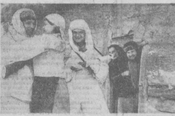
БРЯНСКИЙ ФРОНТ. 1942 год. (Орловская область). НА СНИМКЕ: жители деревни Соломовки встречают своих освободителей.