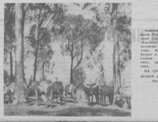
Важное место в экономике Руанды, африканской страны с отсталым сельским хозяйством, занимает животноводство. На горных пастбищах и в долинах крестьяне выводят из овец, крупный рогатый скот.