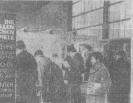
В ЗАПАДНОМ БЕРЛИНЕ была проведена международная выставка туризма, в которой приняли участие свыше 150 туристских организаций более 30 стран, в том числе Советского Союза. На снимке: у выставочного стенда «Интурист». Слева на щите — реклама традиционных фестивалей искусств Советского Союза.

Выступая по радио и телевидению, министр иностранных дел Народной Республики Конго Оксанс Иконга резко осудил американскую агрессию против народов Индонезии и, в частности, вмешательство США в Камбодже и возобновление американцами бомбардировок Демократической Республики Вьетнам. Правительство Народной Республики Конго, заявил министр, самым решительным образом протестует против лицемерной политики американского империализма во Вьетнаме, Камбодже и в Лаосе. Конголезский народ решительно осуждает американскую агрессию в Камбодже. Вьетнаме и Лаосе, требует немедленного вывода американских войск из Индонезии. Конголезский народ вновь заявляет о полной поддержке борьбы народов Индонезии