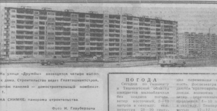
На улице «Дружба» возводятся четыре высотных дома. Строительство ведет Главташкентстрой, монтаж панелей — домостроительный комбинат № 1. НА СНИМКЕ: панорама строительства.

Сегодня по Ташкенту и Ташкентской области ожидается малооблачная дождливая погода без осадков. Ветер восточный, 5-10 м/сек. Температура воздуха 12-17, днем 13-17, ночью 5-10 градусов.