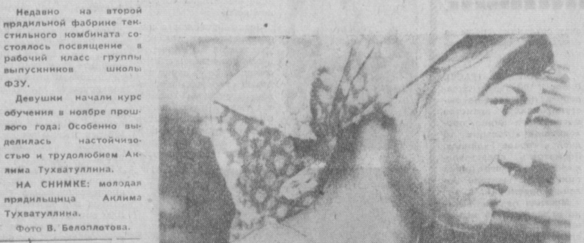
Недавно на второй преддильной фабрике текстильного комбината состоялось посещение в рабочий класс группы выпускников школы ФЭУ. Девушки начали курс обучения в ноябре прошлого года. Особенно выделялась настойчивостью и трудолюбием Аялима Тухватуллина. НА СНИМКЕ: молодая преддильница Аялима Тухватуллина.

нены. Обеспечена реконструкция системы отопления в автоном и спортзалах в школах №№ 188, 179, 138, 18, 77. Закончено строительство спортзала в школе № 45. Оборудование выжата вентильная и физики в школах №№ 101 и 138. А для ребят, которые будут учиться в школах продленного дня №№ 163, 56, 90, выделены новые помещения для занятий. На новый учебный год организованы дополнительно посадочные места в школьных столо-