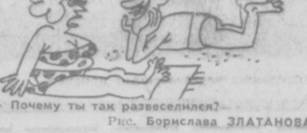
Рис. Борислава ЗЛАНОВА.