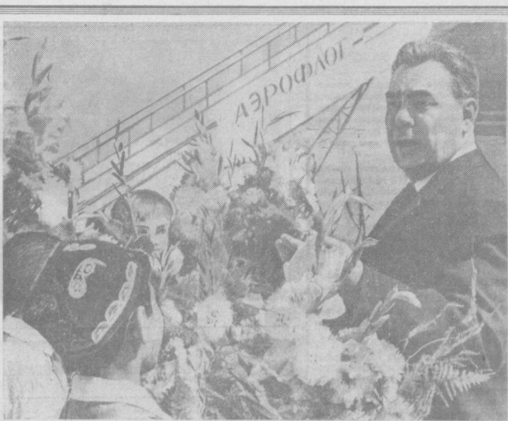
9 сентября 1970 года. В Ташкентском аэропорту.