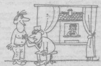
Врач: Ваше сердце мне не нравится — у вас ускоренный пульс.