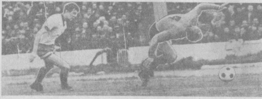
Остановил недовольным приемом.