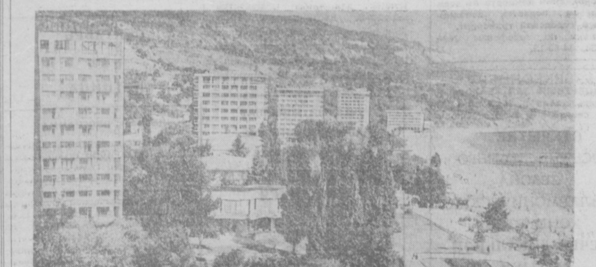
НА СНИМКЕ: «Золотые пески» — известный курорт на Черном море, близ Варны. Комфортабельные современные отели, благоустроенный пляж привлекают сюда многочисленных туристов.

ГЭС у Железных ворот. В БУХАРЕСТ. Румынские и югославские строители отметили шестилетие совместных работ по созданию гидроэнергетического комплекса на Дунае у Железных ворот. На торжествах в югославском городе Кладово и в румынском городе Турну-Северине были подведены итоги работы за последний год.