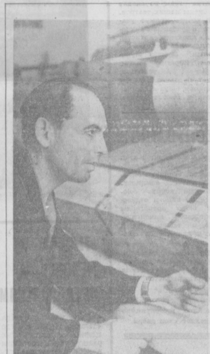
НА СНИМКЕ: ударник коммунистического труда, один из лучших мастеров взаимного цеха трикотажной фирмы Л. Комиссар.

Сейчас все, о чем мы говорим на своих собраниях, что ни делаем, нацелено на достойную встречу XXIV съезда партии. Вот недавно было у