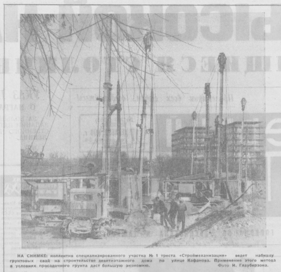
НА СНИМКЕ: коллектив специализированного участка № 1 треста «Строймеханизация» ведет набивку грунтовых свай на строительстве девятиэтажного дома по улице Нафанава. Применение этого метода в условиях просадочного грунта даст большую экономию.

В СТАТЬЕ «На бумаге хорошо...» от 22 октября говорилось о том, что кирпичные заводоуправление № 3 плохо подготовлено к работе в осенне-зимний период. Руководство управления сообщило, что статья обсуждалась на специальном совещании с участием начальников цехов и членов обкома Госплана. Факты подтвердились. Одновременно была произведена проверка выполнения намеченных мероприятий и приняты меры для ускорения работ по подготовке к зиме. Вечерний Ташкент 2 стр. 17 декабря 1970 г.