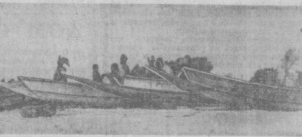
Сенегал. Рыбачи готовятся к выходу в море.

● РИМ. (ТАСС). За последние двое суток отмечена значительная активизация действующего вулкана Этны. Поток лавы, извергнутой из кратера, спустился по северо-западному склону на полтора километра. Извержение в его нынешних масштабах не представляет угрозы для людей, поскольку населенные пункты расположены далеко от вулкана.