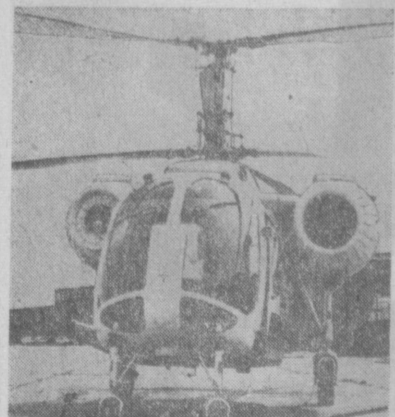
Авиационная компания ГДР «Интерflug» успешно использует самолеты и вертолеты советского производства.

Музей размещен в новом доме. Здесь выставлены многие личные вещи поэта, его произведения.