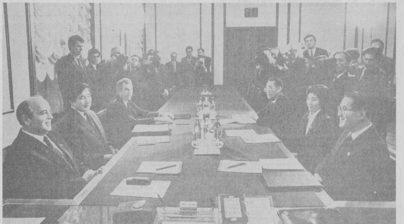
НА СНИМКЕ: во время беседы.