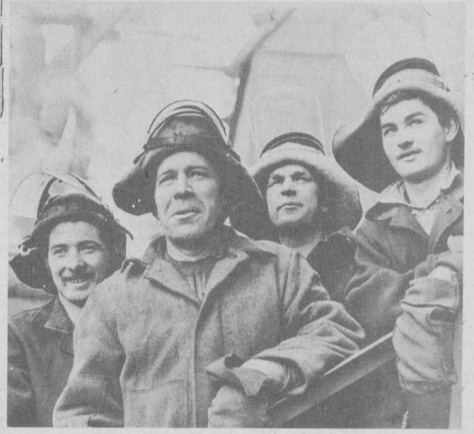
НА СНИМКАХ: страна от края до края.

В созвездии равных празднуют 63-летнюю годовщину образования СССР все народы и представители многочисленных национальностей нашей страны. Незунаваемо преобразилась жизнь Страны Советов за эти годы. В этот период достигнуты значительные успехи в областях народного хозяйства, науки, культуры, свидетельствующие о претворении в жизнь заветов великого Ленина,