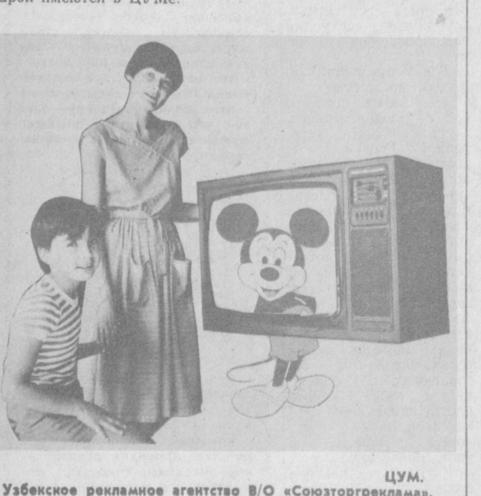
Узбекское рекламное агентство В/О «Союзторгреклама» (телефон 45-37-27).

на экранах «РАДУГИ» и «РУБИНА». «РАДУГА-716» и «РАДУГА-716 Д» — унифицированные ламповоуполупроводниковые телевизоры II класса. Размер экрана по диагонали — 61 см.