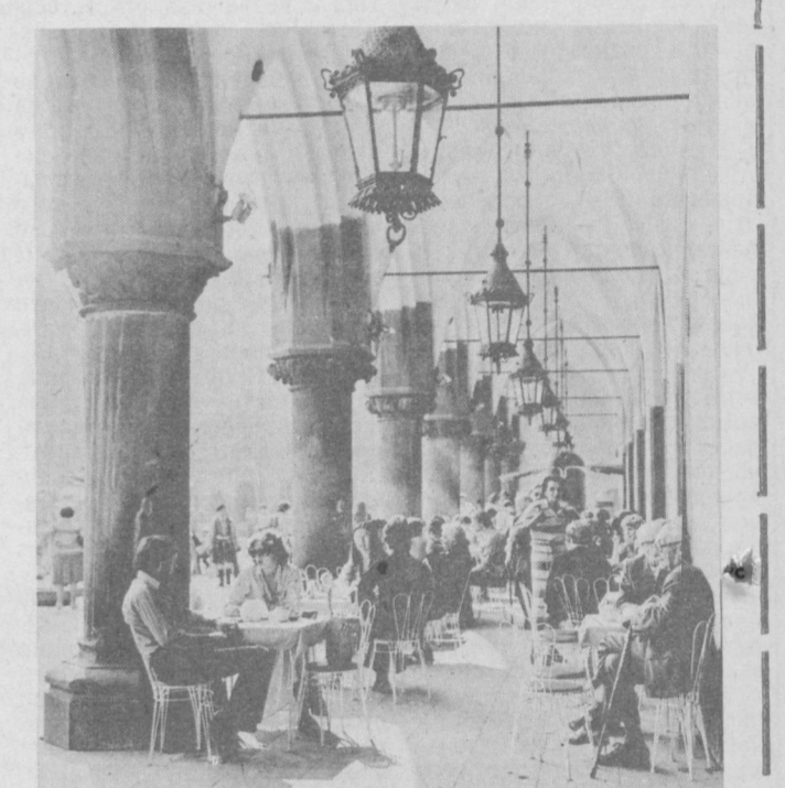
Древняя столица Польши Краков и столица Советской Украины Киев — города-побратимы. Их дружба имеет давние и прочные связи. «Кемчужина польской архитектуры и культуры», как называют Краков поляки, была осовоенена от подготовленного гитлеровцами полного разрушения ойсакми Первого Украинского фронта.

БЕРЛИН. Большой интерес посетителей Международной осенней ярмарки в Лейпциге вызывает советская экспозиция. В павильоне и на открытых площадках показывают свою продукцию более 300 промышленных предприятий СССР. 80 проц. экспонатов, среди которых химические установки, транспортные средства, товары широкого потребления, — это новинки, которые демонстрируются впервые. Экспонаты рассказывают об усилиях советского народа по выполнению решений XXVII съезда КПСС, ускорению научно-технического прогресса. Сотни экспонатов в советском павильоне свидетельствуют о плодотворности научно-технического сотрудничества между СССР и ГДР, которому в этом году исполняется 35 лет. Изготавливаемые изделия называются о взаимовыгодной кооперации двух братских стран в разработке производственной технологии, позволяющей способом высокого давления — «Полмир-50», по выпуску новых изделий в рамках международной кооперации. Специалисты двух стран совместно освоили производство более 80 новых видов товаров бытовой химии. Отдельный раздел сетевой экспозиции посвящен достижениям Туркменской ССР. Экспонаты аналогичны опыту использования огромной энергии в народном хозяйстве республики, современным методами разработки природного газа.