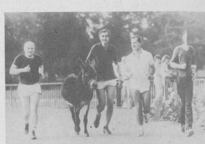
ГДР. Очень покладистым, вопреки бытующему мнению, оказался элик. Он охотно «согласился» принимать участие в забегах этих четверых жителей Лейцига...