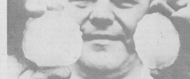
ФРГ. Большой урон причинил внезапный вал с градом, обрушившийся на южные районы страны. Во многих местах уничтожены большие плады посевов...