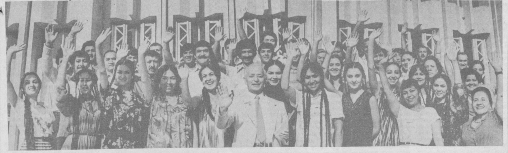
НА СНИМКЕ: участники Всесоюзного фестиваля искусств Ташкентская «Золотая осень».