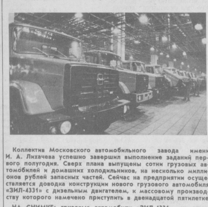
Коллектив Московского автомобильного завода имени И. А. Лихачева успешно завершил выполнение заданий первого полугодия. Сверх плана выпущены сотни грузовых автомобилей и домашних холодильников, на несколько миллионов рублей запасных частей. Сейчас на предприятии осуществляется доводка конструкции нового грузового автомобиля «ЗИЛ-4331» с дизельным двигателем, к массовому производству которого намечено приступить в двенадцатой пятилетке.