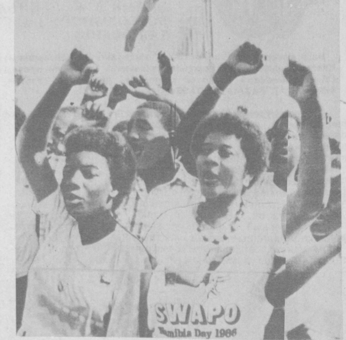
НАМИБИЯ. Более 7 тысяч человек приняли участие в манифестации, посвященной 20-летию начала освободительной борьбы намибийского народа против расистов АР под руководством Народной организации Юго-Западной Африки (СВАПО). Выступившие в ходе манифестации торжественно поклялись, что, несмотря на широкую экономическую и военную помощь, которую администрация США оказывает расистскому режиму ЮАР, СВАПО будет продолжать борьбу за освобождение Намибии от южноафриканских агентов до полной победы. За 20 лет существования Надио-освободительной армии Намибии (ПЛАНА) ее бойцы уничтожили сотни солдат противника, вынудили расистов уличить свою оккупационную армию до 160 тысяч человек. Яна в Намибии обходится режиму апартеида во многие миллионы долларов. НА СНИМКЕ: участники манифестации в Витхукте.