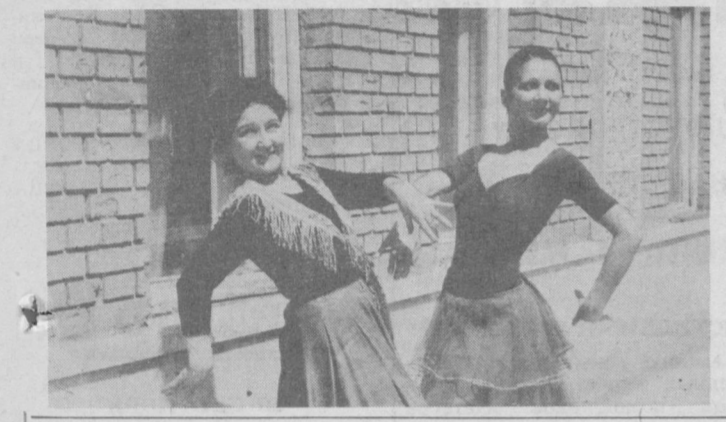
НА СНИМКЕ: кадр из фильма.