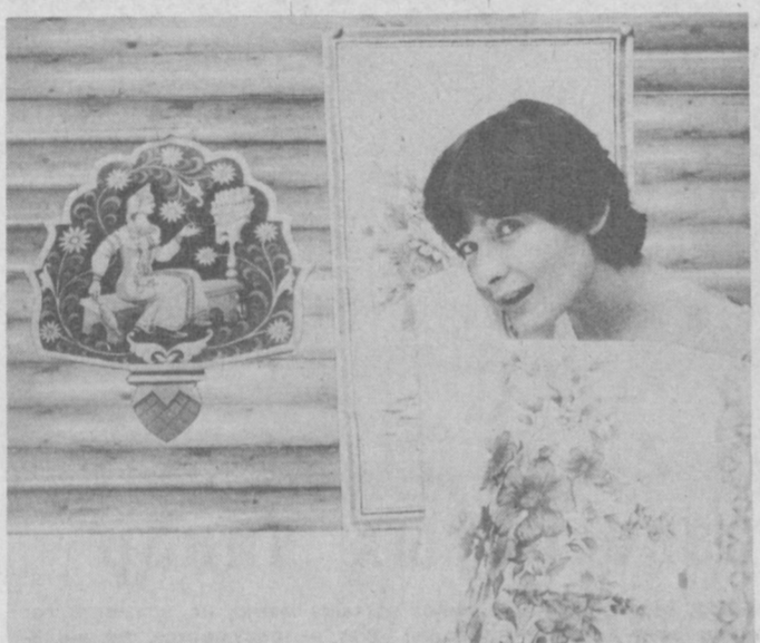
Ташкентский текстиль (телефон 78-72-42).