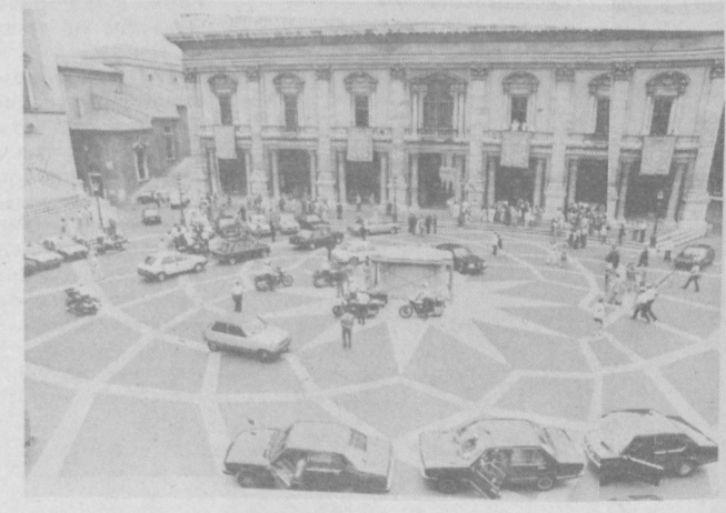
Знаменитый итальянский живописец, скульптор Микеланджело Буонаротти известен также как выдающийся архитектор. Он руководил строительством таких шедевров архитектуры, как собор святого Петра, ансамбль Китоля в Риме. И по сей день творения Микеланджело привлекают к себе внимание многих ценителей искусства. НА СНИМКЕ: площадь в Риме с мозаикой келанджело.

ОТТАВА. Все большее число канадцев выступают против заключения наваз в вем о Соединенными Штатами соглашения о «свободной торговле». Об этом свидетельствуют результаты опроса общественного мнения, проведенного одной из исследовательских фирм для газеты «Торонто стар». Согласно его данным, 53 проц. канадцев, проживающих в Онтарио — самой многонаселенной и индустриально развитой провинции Канады, — высказались против такого соглашения, 67 проц. опрошенных заявили, что они «весьма встревожены перспективой потери работы в сфере заключения такого соглашения с США. Чем больше канадцы осознают, какую угрозу оно представляет для экономики и суверенитета страны, тем больше они боятся его, заявив в этой связи родившейся фирме, которая проводила опрос. Вашингтон добится от своего северного партнера, в частности, отмены возможных ограничений на вв в Канаду американских товаров. Такой шаг, как указывала местная печать, вызовет явные негативные тенденции экономике страны».