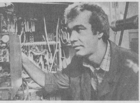
Завтра — День машиностроителя