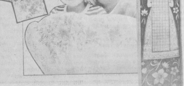
Ташкентфильмторг (телефон 78-72-42).

Транспорт: трамваи №№ 4, 7, 9, 11, 28; троллейбусы №№ 13, 16, остановка «Парк им. Кирова».