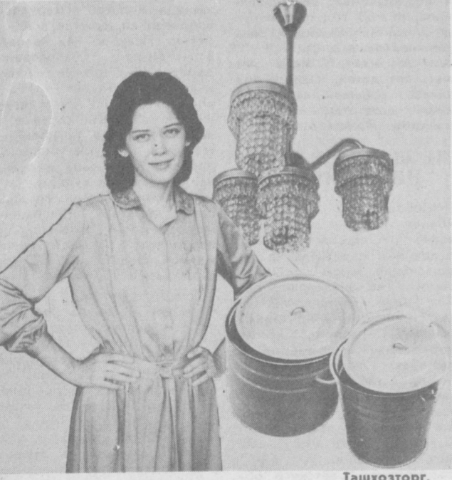
Ташкозторг. Узбекское рекламное агентство В/О «Союзторгреклама» (телефон 45-37-27).

ОСУЩЕСТВЛЯЮТ ПРОДАЖУ ПО СНИЖЕННОМУ ЦЕНАМ: СВЕТЛЫХНИКОВ производства предприятий Чехословакии и Югославии — на 30—40%; КОВРОВ импортных и отечественного производства — на 20%; ИЗДЕЛИЯ ИЗ ХРУСТАЛЯ импортных и отечественного производства — на 20%; ЭМАЛИРОВАННОЙ ПОСУДЫ (темных тонов) — на 20%.