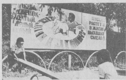
По почину вазовцев

И все же машинный способ уборки пробивает дорогу медленно. Плохо используют комбайны в Бухарской, Андижанской, Наманганской, Самаркандской и Сырдарьинской областях. Оттого и