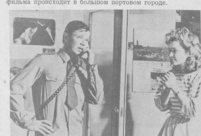
Производство киностудии им. М. Горького.

В ролях: А. Ростоцкий, Т. Догилева, Н. Вавилова и другие. Детектив о предотвращении советскими пограничниками одной из операций иностранной разведки. Действие фильма происходит в большом портовом городе.