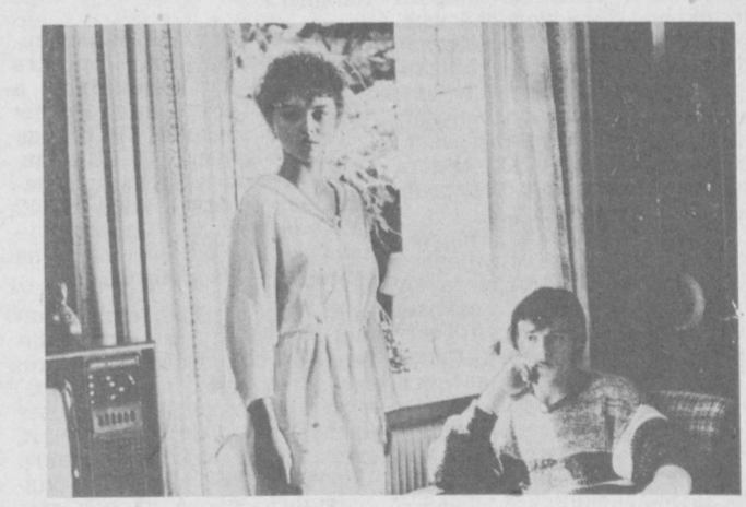
Производство киностудии «Беларусьфильм».