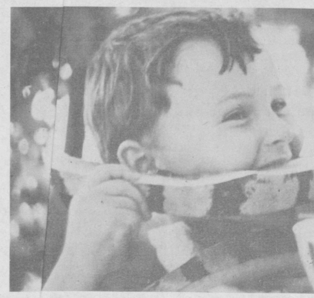
какой сладкий арбуз!

Заботы о чистоте воды, человек стал строить всевозможные системы очистки — механические, улавливающие всевозможный мусор, химические, биологические, где микроорганизмы разлагают сложные органические соединения в простые минеральные вещества. Такие биофильтры в настоящее время существуют во всех крупных городах. А как быть небольшим городкам, поселкам? Здесь на помощь человеку пришли растения. В первую очередь ученые обратили внимание на водоросли, которые растут в обычном пруду. В результате исследований было выбрано около десяти видов водорослей, которые наиболее активно выделяют кислород — до 25 граммов на квадратный метр в сутки. В процессе жизнедеятельности этих водорослей создаются благоприятные условия для развития аэробных микробов, которые содействуют окислению основных загрязнителей — аммонийных солей, нитратов, сероводорода, углеродистых соединений и других.