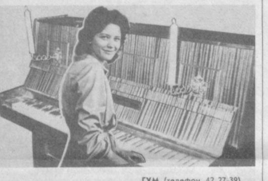
ГУМ (телефон 42-27-39).

Выбрать фортепиано сможете и вы в ташкентском ГУМе. В продаже инструменты отечественного производства и импортные: «БЕЛАРУСЬ» (цена — 590, 760, 785 руб.); «НОКТОРН» (690 руб.); «ВЛАДИМИР» (675 руб.); «ФАНТАЗИЯ» (675 руб.); «ЛИРИКА» (690 руб.); «ПЕТРОФ» — ЧССР (1.200 руб.); «РОИМХИЯЕТ» — ЧССР (1.615 руб.); «РОЙНИШ» — ЧССР (1.370 и 1.550 руб.).