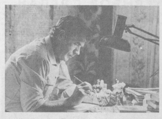
Твое свободное время