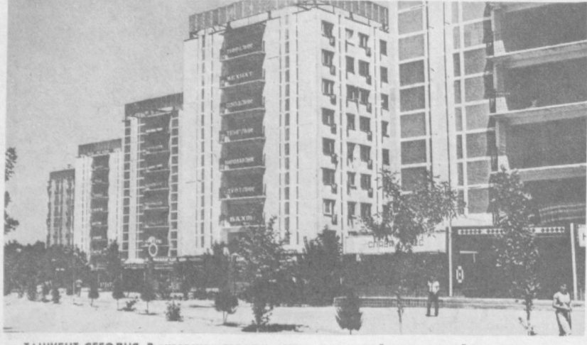
ТАШКЕНТ СЕГОДНЯ. В вузовском городке вырос этот жилой студенческий комплекс.