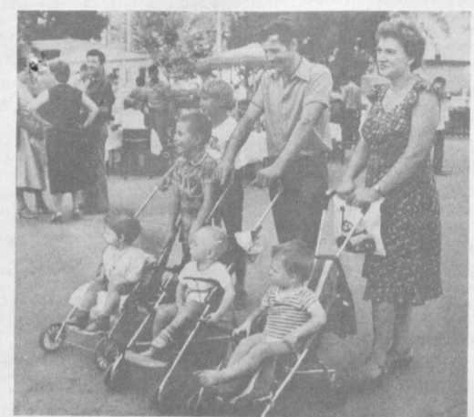
НА СНИМКАХ: сверху — в сенции шахмат и шашек клуб железнодорожников с увлечением занимаются и взрослые, и дети; внизу — «Когда мы отдыхаем».