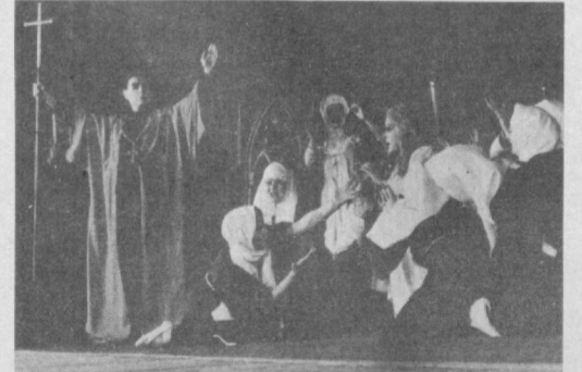
НА СНИМКЕ: сцена из спектакля «Огненный ангел».

пор это выдающееся произведение нашло воплощение только на ташкентской сцене. Признаться, с определенными сомнениями шли мы на этот спектакль: очень уж сложен «Огненный ангел» для постановки. Но постановщики спектакля сумели бережно и в то же время по-настоящему современно воплотить это произведение на сцене. На мой взгляд, ташкентский «Ог-