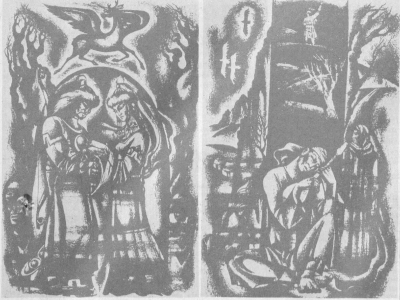
Волшебный мир искусства