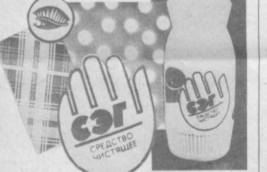
Фирменный магазин № 1 НПО «Узбытпластик». Узбекское рекламное агентство В/О «Союзторгреклама» (телефон 45-37-27).

Адрес: г. Ташкент, проспект «50 лет УзССР» (троллейбусы: 1, 2, 7, 21; автобусы: 47, 100, остановка «Магазин «Ганга»).