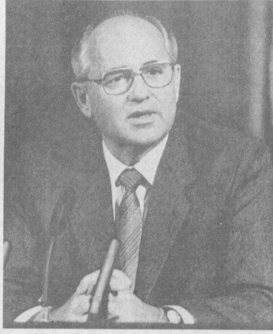
Во время пресс-конференции.