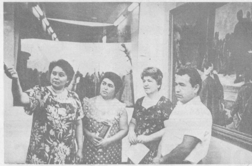
В республиканский Дом научного аттестации часто приходят лекторы и пропагандисты, партийные и комсомольские активисты, слушатели различных аттестационных клубов. Специальные брошюры и фотографии, художественные полотна рассказывают посетителям о героических и сложных годах борьбы за становление Советской власти в Туркестане, которая была неотделима и от борьбы с религиозными предрассудками.

Думаю, излишне говорить о том, насколько важен в воспитании положительный пример взрослых, педагогов. И над этим партийная организация, педагогический коллектив школы стоит задуматься. Требуя дисциплины и ответственности от учеников, призывая их к постоянному повышению уровня знаний, учителям стоит повысить требовательность и к себе. Взять хотя бы занятия в системе мар-