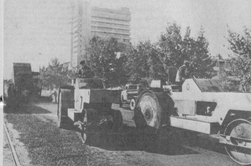
Ташкент готовится к празднику. НА СНИМКЕ: по улице Энгельса идут благоустроительные работы.

Итак, давайте расскажем о Дне мира 1986 года. Агентство печати Новости.