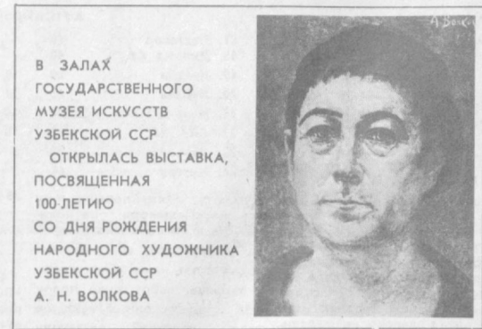
В ЗАЛАХ ГОСУДАРСТВЕННОГО МУЗЕЯ ИСКУССТВ УЗБЕКСКОЙ ССР ОТКРЫЛАСЬ ВЫСТАВКА, ПОСВЯЩЕННАЯ 100 ЛЕТИЮ СО ДНЯ РОЖДЕНИЯ НАРОДНОГО ХУДОЖНИКА УЗБЕКСКОЙ ССР А. Н. ВОЛКОВА

Александр Николаевич Волков родился в 1886 году в Фергане. Закончив кадетский корпус, поступил в Петербургский университет. Но ни военная, ни ученая карьера не увлекли Волкова. Он бросил все ради искусства, которое полностью захватило его творческую натуру, стало для него главным в жизни. Вначале он учится в Петербургской академии художества у В. Маковского, затем в частных мастерских