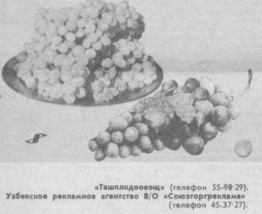
«Ташплодоовощ» (телефон 55-98-29). Узбекское рекламное агентство В/О «Союзторгреклама» (телефон 45-37-27).

ПОКУПАЙТЕ ВИНОГРАД В МАГАЗИНАХ «ТАШПЛОДОВООЩ!»