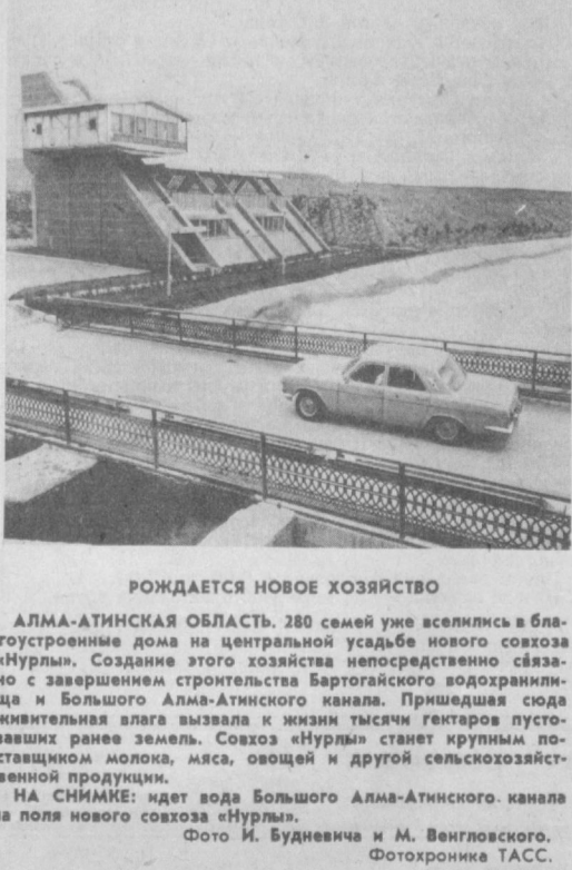
РОЖДАЕТСЯ НОВОЕ ХОЗЯЙСТВО АЛМА-АТИНСКАЯ ОБЛАСТЬ. 280 семей уже вселились в благоустроенные дома на центральной усадьбе нового совхоза «Нурлы». Создание этого хозяйства непосредственно связано с завершением строительства Бартогайского водохранилища и Большого Алма-Атинского канала. Пришедшая сюда жилая масса вызвала к жизни тысячи гектаров пустовавших ранее земель. Совхоз «Нурлы» станет крупным поставщиком молока, мяса, овощей и другой сельскохозяйственной продукции. НА СНИМКЕ: идет вода Большого Алма-Атинского канала на поля нового совхоза «Нурлы».