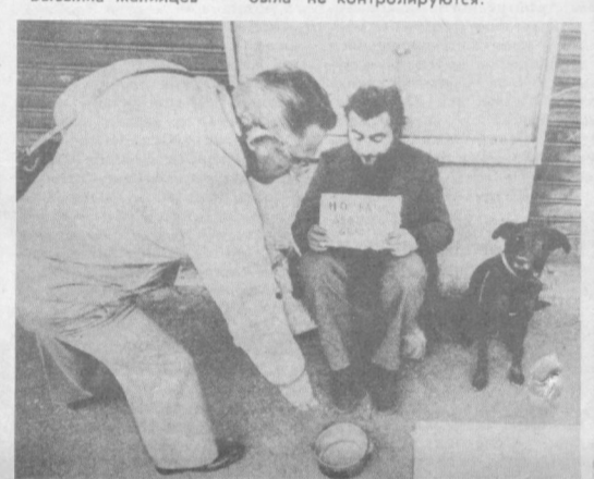
ИТАЛИЯ. Лишившись жилья и средств к существованию, этот безработный вынужден просить милостиню (на снимке). Он один из 2 миллионов 600 тысяч итальянцев, лишенных одного из основных прав человека — права на труд, оказавшихся «лишними» в буржуазном обществе.

Эти реформы, в частности, предусматривали расширение репрессивных функций полиции, которая получила дополнительные права для проведения обысков, облав, задержания граждан. Согласно новому законодательству, подчеркивая действия полиции фактически не контролируются.