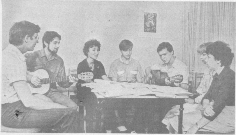
Около двух лет существует при Дворце культуры железнодорожников «Клуб самодеятельной песни»...