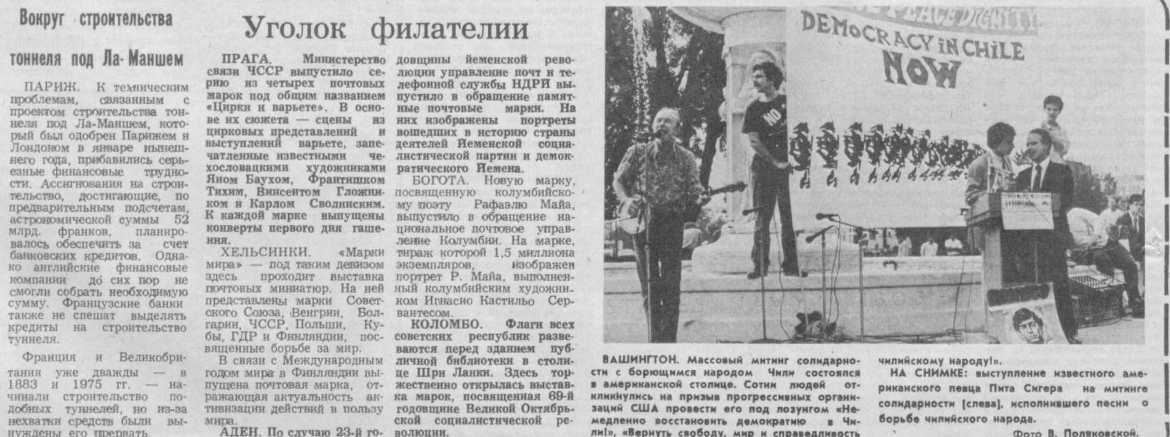
ВАШИНГТОН. Массовый митинг солидарности с борющимися народом Чили состоялся в американской столице. Сотни людей откликнулись на призыв прогрессивных организаций США провести его под лозунгом «Немедленно восстановите демократию в Чили!» «Вернуть свободу, мир и справедливость чилийскому народу!». НА СНИМКЕ: выступление известного американского певца Пита Сингера на митинге солидарности (слева), исполнившего песни о борьбе чилийского народа.

ДЕЛИ. «Эстафета мира», проходящая по многим странам под девизом «Дайте планете шанс — детям нашей планеты», отправилась в путь по индийской земле. Начавшийся в индийской столице маршрут «Эстафеты мира» пройдет через крупнейшие города Индии. Ее участниками предстоит преодолеть свыше 20 тысяч километров. 2 ноября эстафета покинет Индию и вступит на территорию Бангладеш.