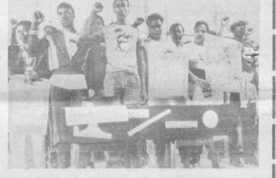
Около 250 тысяч шахтеров в ЮАР отказались опуститься в забой. По призыву Конгресса южноафриканских профсоюзов, они объявили забастовку в память о 177 горняках, погибших 16 сентября в результате катастрофы на золотом руднике Киросс. Как подчеркнул организаторы этой акции, она проводится также в знак протеста против апартеида. Конгресс обратился к трудящимся других секторов экономики с призывом принять участие в «национальном дне траура». Несмотря на жесткие ограничения на проведение политических манифестаций в государстве апартеида, это уже пятая всеобщая забастовка рабочих-африканцев, организованная в текущем году.

Предполагается, что «европейский щит» оградит Западную Европу от ракет с дальностью до тысячи километров. Разработку «европейского щита», сообщает далее «Република», предполагает провести в рамках американской программы «звездных войн». Эта идея, высказанная впервые год назад министром обороны ФРГ Манфредом Вернером, получила поддержку западных НАТО. Теперь же от теоретических рассуждений на этот счет перешли к разработке конкретного проекта, с беспокойством комментирует газета.