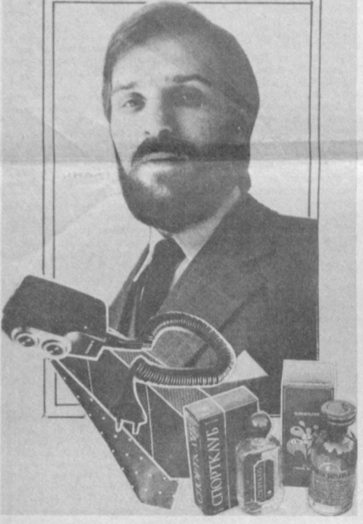
Торговая фирма «Ташкент» (телефон 24-25-96).

ВСЕ, ЧТО НУЖНО МУЖЧИНЕ — В ПОДАРОЧНЫХ МАГАЗИНАХ ТОРГОВОЙ ФИРМЫ «ТАШКЕНТ» ЗДЕСЬ В ПРОДАЖЕ: ОДЕЖДА И ТРИКОТАЖ; ЧАСЫ наручные механические «СЛАВА», «ЗИМ», «ПОЛЕТ»; ЭЛЕКТРОБРИТВЫ лучших отечественных марок «ХАРЬКОВ», «ЭРА», «МИКМА», «НЕВА»; ОДЕКОЛОНЫ: «О'ЖЕН», «ДИСКО», «ИВ»; Есть что приобрести здесь и для женщины. Особенно большой выбор косметики, парфюмерии, галатереи. В эти предпраздничные дни приглашаем посетить магазины: № 8 — массив Алмазар, дом 6—7 (метро — станция «Площадь Дружбы народов»); № 12 — проспект Дружбы народов, 5 (метро — станция «Хамза»); № 16 — Луначарское шоссе, 123 (автобус 101, остановка «ул. Севастопольская»); 5—6 ноября магазины работают до 22 час.