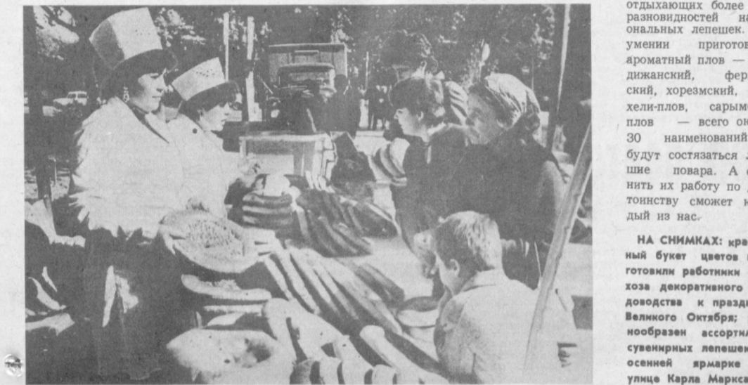
Служба для всех

Всем полонились массовые гуляния по улице Карла Маркса. Интересно проводят здесь свой досуг ташкентцы целыми семьями. 7 и 8 ноября улица, ставшая пешеходной зоной, приглашает на праздник лепешки и плова и на последнюю в этом году веселую встречу друзей. Опытные мастера-хлебопеки испекут для отдыхающих более 15 разновидностей национальных лепешек. В умении приготовить ароматный плов — андижанский, ферганский, хорезмский, белхелли-плов, сарымсок-плов — всего около 30 наименований — будут состязаться лучшие повара. А оценить их работу по достоинству сможет каждый из нас.