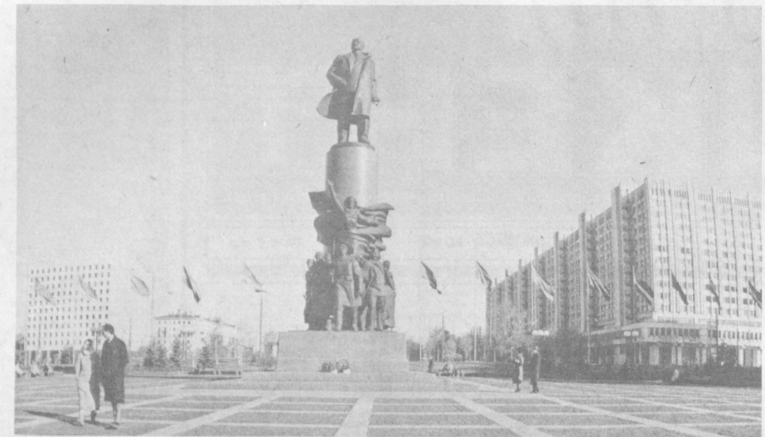
МОСКВА. Памятник В. И. Ленину на Октябрьской площади столицы.

Секретарь исполкома Ташгорсовета В. МАНАСТЫРЕТСКАЯ.