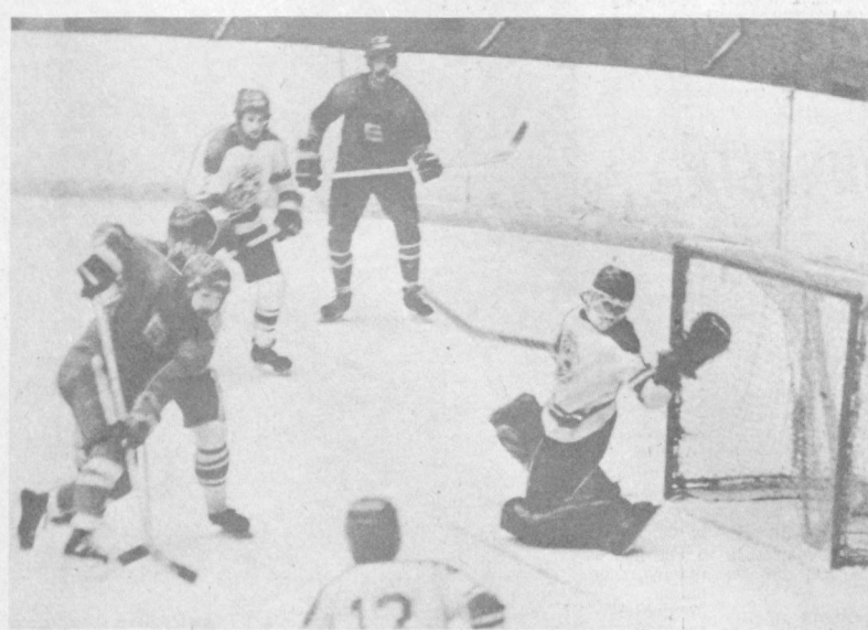
В игре «Бинокор».