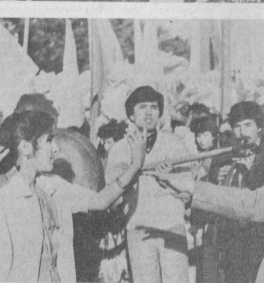
▲ ТАШКЕНТ. 7 ноября 1986 года. Военный парад и демонстрация трудящихся.