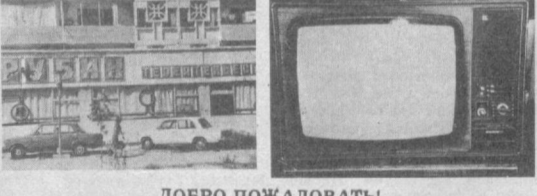
ДОБРО ПОЖАЛОВАТЬ! Ташкентское городское производственное объединение «Голубой экран».

Это не только название завода по ремонту радиотелевизионной аппаратуры. Прежде всего это гарантия качества работы и своевременного исполнения заказа. Какие же услуги предоставляются? Техническое обслуживание и ремонт телевизоров цветного и черно-белого изображения всех марок стационарных и переносных. Доставка телевизора для ремонта на завод и обратно на дом. Ремонт телевизионной аппаратуры обычный и гарантийный. Рекомендуем заключить договор на абонентное обслуживание телевизора. Вы убедитесь, что это удобно и выгодно. Наш адрес: г. Ташкент, Ахангаранское шоссе, 111 (трамвай: 6, 29; автобусы: 30, 161, 171, остановка «Таджик махалля»). Телефоны: 96-38-71, 96-45-72. В филиале завода «Рубин» ремонтируют бытовую радиоаппаратуру любых марок: радиоприемники, магнитофоны, усилители. Адрес: г. Ташкент, ул. Лисюнова, 17. Дом быта (трамвай: 3, 23; автобусы: 48, 72, 80, 161, остановка «Дворец авиастроителей»). Телефон 96-43-52.