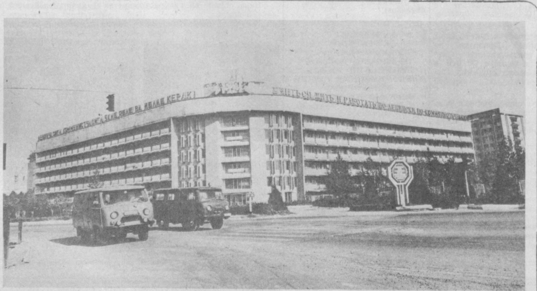
ТАШКЕНТ СЕГОДНЯ. НА СНИМКЕ: ул. Краснопресненская.