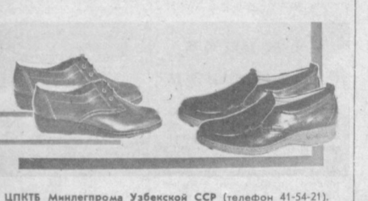
ЦПКБТ Минлепрома Узбекской ССР (телефон 41-54-21).

Полуботинки — наиболее удобная обувь для осеннего сезона. Легкие, красивые, удобные полуботинки для мужчин всех возрастов выпускает ТАШКЕНТСКАЯ ОБУВНАЯ ФАБРИКА № 1. Для мальчиков: верх из хрома, коричневого и черного цветов, подошва из облегченного полиуретана. Цена — 8 руб. 70 коп.