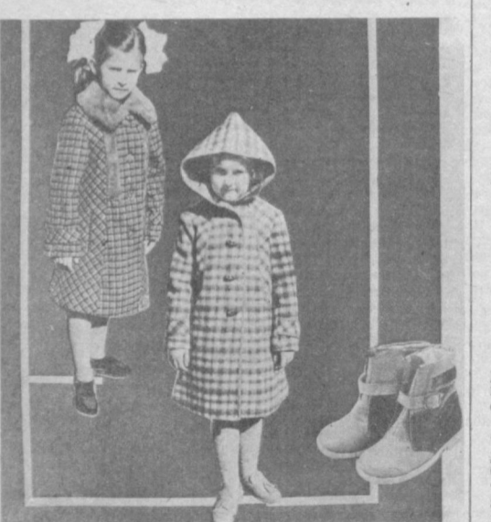
Торгово-розничная фирма «Детский мир» (телефон 42-56-40).

О том, чтобы вашим детям было тепло в зимние холода, необходимо позаботиться уже сегодня. Пальто для малышей вы сможете купить в магазинах торгово-розничной фирмы «Детский мир». В ПРОДАЖЕ: пальто для девочек с меховым воротником, низ оторочен мехом. Размеры: 24—30, цена — 20 руб. 40 коп. и 20 руб. 90 коп.; пальто для девочек в клетку с меховым воротником. Размеры: 28—30, цена — 27 руб. 40 коп.; пальто для девочек демисезонное красного цвета. Размеры: 24. Цена — 19 руб. 20 коп.; пальто для мальчиков в клетку. Размеры: 38—40. Цена — 22 руб.