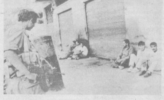
Окупанты продолжают репрессии на оккупированных территориях. Израильские оккупационные власти провели аресты среди палестинцев в городе Газе, сообщает агентство МЕНА. Стремлясь сплотить выступления арабского населения против окупантов, израильские силы безопасности установили комендантский час в Газе и населенном пункте Барака на Западном берегу реки Йордан и проводят там массовые облавы и обыски. НА СНИМКЕ: группа арестованных палестинцев в городе Газе.