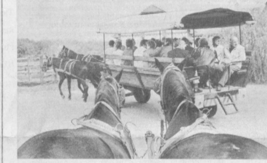
Из дальних странствий возвратясь