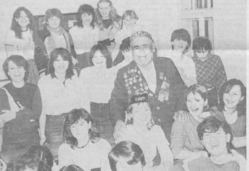
По законам дружбы