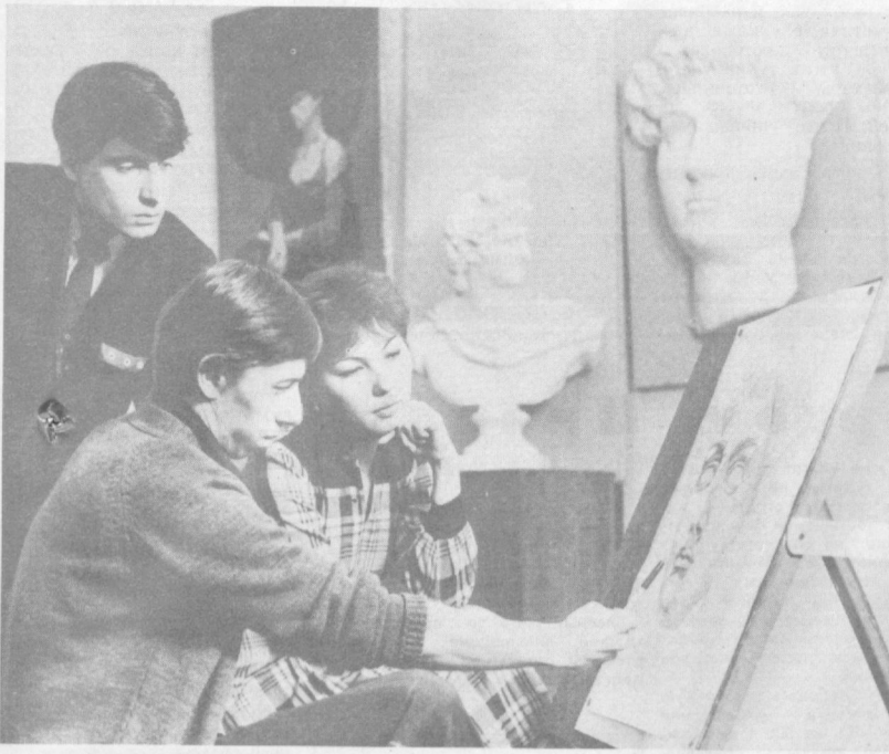
Дворец культуры и техники Ташкентского авиационного производственного объединения имени В. П. Чкалова. Здесь работают 168 кружков, 10 общественных университетов, 19 клубов по интересам. Действуют ансамбли фольклорные, народных инструментов, студии балетная, хоровая, изобразительного искусства, много других коллективов художественной самодеятельности. В них нашли дело по душе более пяти тысяч человек — взрослых и детей.