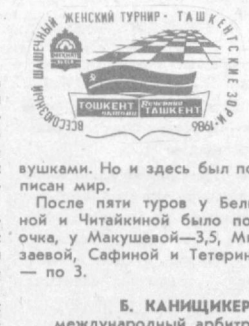
ЖЕНСКИЙ ТУРНИР — ТАШКЕНТ