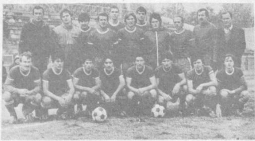
Футбол. Чемпионат Узбекистана