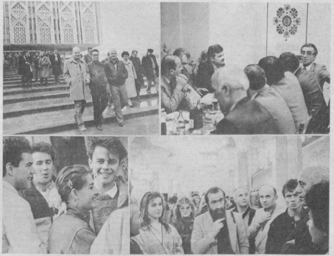
НА СНИМКАХ: гости из Македонии знакомятся с достопримечательностями Ташкента; встреча с журналистами «Вечерки».