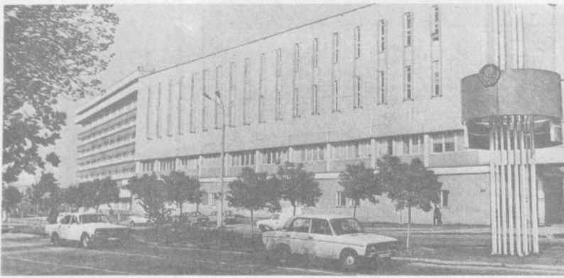
Новый узел связи и АТС-34 на 10 тысяч номеров построен на Софийском проспекте. НА СНИМКЕ: вид нового узла связи.

Т. РАХИМОВА, жительница массива Черданцева-1.