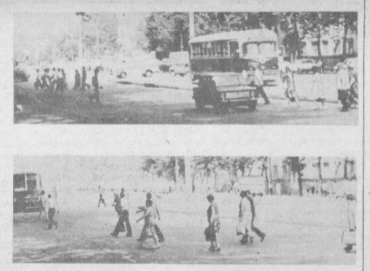
— из трамвайно-троллейбусного управления и многие другие.

По выявленным нарушениям Правил дорожного движения Госавтоинспекция направляет информацию в адрес руководителей предприятий, организаций и учебных заведений с просьбой принять меры к нарушителям пешеходов.