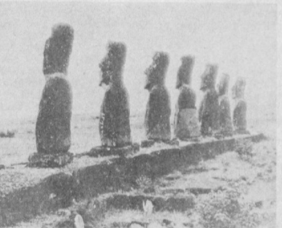
НА СНИМКЕ: безмолвные стражи острова Пасхи.

языке рапануи, что можно начинать. Я с громадным волнением ожидал первого шага. Хотя стояла жара выше 30 градусов, на лбу у меня выступил холодный пот... Веревки тянули одновременно восемь человек. Но вначале моаи даже не пошевелились. Оказалось, что помощники только делают вид, что тянут, а на самом деле веревки висели свободно. Дело в том, что для местных жителей все это было не только развлечением, но и работой, «хлебом», а значит, требовало солидарности. Пришлось прибегнуть к помощи Хейердала, и по его призыву к веревкам сбросилось едва ли не все население острова. Две статуи, изобранные для эксперимента, прошли — одна шесть метров, другая — десять. Первая была высотой 4 метра и весила 11 тонн, вторая была поменьше, достигая всего 2,7 метра и веса 5 тонн.