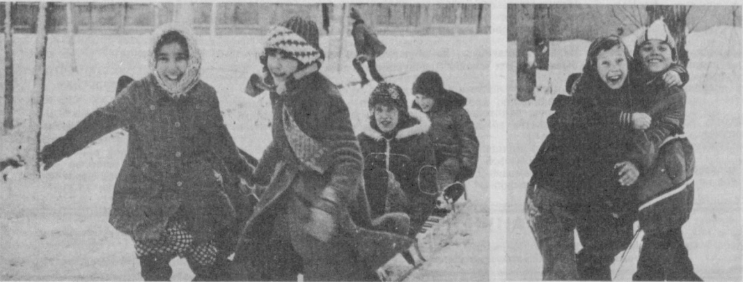
Зимние шалости.

Мелкая наждачная бумага с завернутой в нее пробкой поможет легко отшлифовать лезвие ножа. ТОРТ легче всего разрезать туго натянутой ниткой.