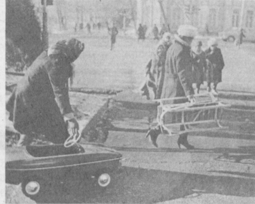
Новогодние подарки.