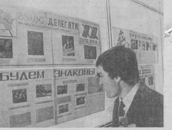
▲ В зале заседания конференции. ▲ У экспозиций, подготовленных комсомольскими организациями города.