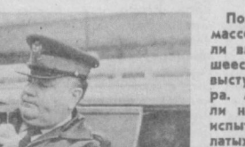
Полицейским террором и массовыми арестами власти Оттавы в составившей в канадской столице выступление сторонников мира.

НА СНИМКЕ: арест участника манифестации в Оттаве.