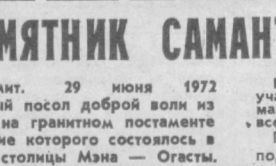
Полицейским террором и массовыми арестами власти Оттавы в составившей в канадской столице выступление сторонников мира.

НА СНИМКЕ: арест участника манифестации в Оттаве.