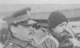
Полицейским террором и массовыми арестами власти Оттавы в составившей в канадской столице выступление сторонников мира.

КАИР В Порт-Саиде — главном опорном пункте египетского сопротивления тройственной агрессии 1956 года — состоялся праздничный митинг, посвященный 30-летию победы. Тридцать лет назад силы империализма и реакционеры предприняли попытку задушить молодую египетскую республику. Однако попытка англо-франко-израильских войск оккупировать страну и сорвать прогрессивные социально-экономические преобразования была сорвана мужественной борьбой египетского народа.