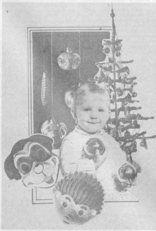
Ташкульторг (телефон 77-23-12). «Союзторгреклама» (телефон 45-37-27).