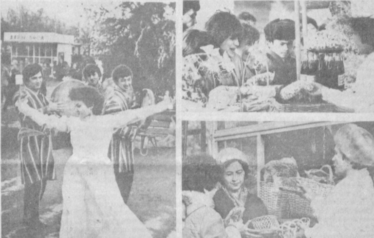
НА СНИМКАХ: предпраздничная торговля на Октябрьского района столицы.