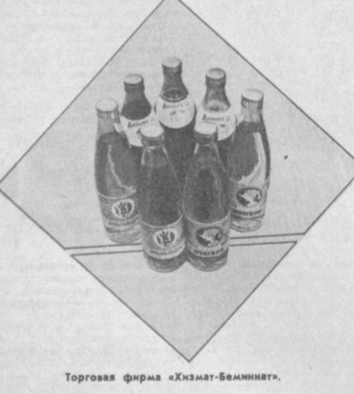
Торговая фирма «Хизмат-Беминнат».

Магазины торговой фирмы «Хизмат-Беминнат» есть в каждом районе Ташкента, и покупатели охотно пользуются в них услугами столов-заказов. НАПОМИНАЕМ, что по вашему желанию, товары достаточного ассортимента могут быть доставлены на дом. Для этого необходимо сделать заказ фирме непосредственно в салонах заказов или по телефону. Сообщаем адреса и телефоны магазинов: № 1 — массив Чиланзар, квартал 23, ул. Подмосковная, 57. Телефон 74-79-79; № 2 — массив Чиланзар, квартал 6, ул. Мукими, 5. Телефон 78-00-41; № 3 — ул. В. Хмельницкого, 11. Телефон 55-74-94; № 4 — ул. Саракульская, 98. Телефон 91-09-06; № 5 — ул. Иззат, 30. Телефон 96-13-12; № 6 — проспект М. Горького, 89. Телефон 62-63-24; № 7 — ул. Навои, 20. Телефон 33-06-76; № 8 — ул. Хуршида, 24. Телефон 41-34-98; № 9 — Б. Алмазарская грасса, 2. Телефон 48-40-31; № 10 — ул. Волгодарская, 22. Телефон 78-86-28; № 11 «Универсам» — массив Юнусабад, ул. А. Даниша. Телефон 24-08-73; № 12 «Универсам» — массив Чиланзар, квартал 19, дом 16. Телефон 76-82-17; № 13 «Универсам» — массив Чиланзар, квартал В-23, дом 57. Телефон 74-56-29; № 23 «Универсам» — ул. Абая, 15. Телефон 41-87-50; № 27 «Универсам» — массив Сергели-2. Телефон 57-06-15.