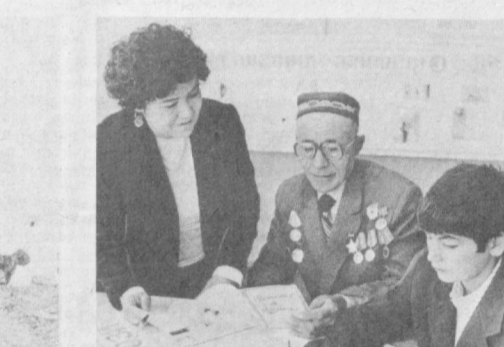
УЗБЕКСКАЯ ССР. В университете научного атташа, созданном в Бухарском техникуме культуры, на двухгодичных курсах занимаются будущие работники библиотек и культурно-просветительных учреждений республики. Различные формы и методы идеологического воздействия используют они в своей работе, проводимой в домах и дворцах культуры, в клубах, в рабочих бригадах и трудовых коллективах животноводческих комплексов.